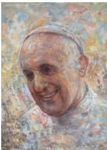
Auguri a papa Francesco che il 13 dicembre ha celebrato 50 anni di sacerdozio

Nei mesi di giugno, luglio e agosto le Messe sono celebrate in Plebana anziché in Santa Maria.